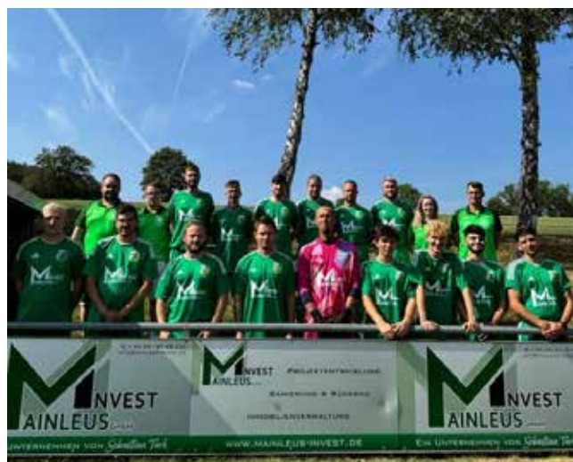
FSV Danndorf - Bande und neue Trikots

Infoblatt: Das klingt nach einer ordentlichen Summe. Lässt sich das beziffern?