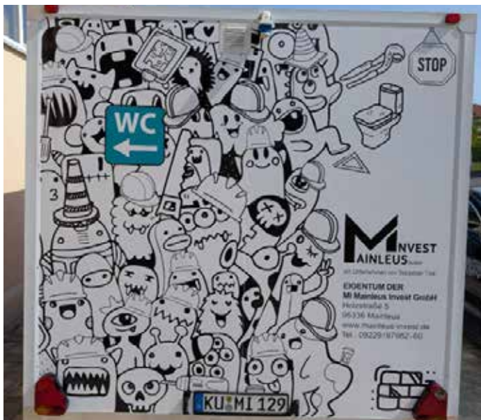
Der WC-Wagen kann ab 2026 kostenlos ausgeliehen werden

S. Türk: Ja, ab 2026 haben wir für unsere heimischen Vereine und Institutionen eine ganz besondere Unterstützung: Wir haben für unsere Baustellen einen eigenen schönen WC-Wagen angeschafft, der ab nächstem Jahr von all unseren heimischen Mainleuser Vereinen kostenlos ausgeliehen werden kann. Dadurch entfällt hoffentlich für viele Feiern ein nicht unerheblicher Kostenpunkt. Gleiches gilt auch für Bauzäune, Absperungen, etc.