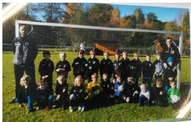
Die Jugend des SV Motschenbach bedankt sich für die großzügige Spende

regelmäßig bei Anschaffungen von Spielgeräten oder Geldspenden, etc.