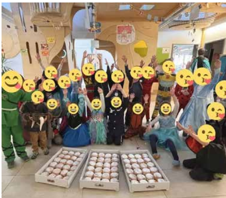
1.300 Faschingskrapfen im Jahr 2025 für die Mainleuser Schulen und Kindergärten