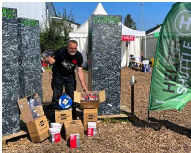
Materialien fürs Ahrtal