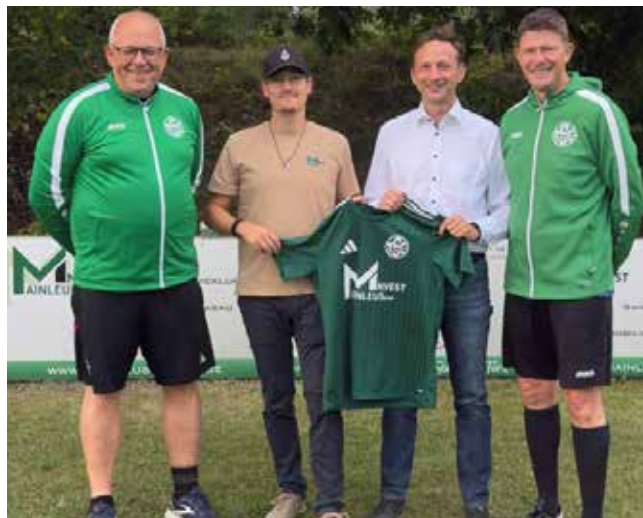
Trikotsponsoring für die 1. Mannschaft des TSC-Mainleus für die Saison 2025/26

Wir haben auch bereits Hotelkosten für hier auftretende Künstler übernommen, mit unseren Handwerkerteams bei Festen oder beim Grünschnitt mit angepackt, usw. Im Prinzip unterstützen wir so, dass es den Vereinen individuell am besten hilft. Wie genau das aussieht, das wissen die Vereine und Institutionen selbst am besten.