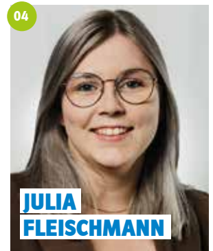
22 Jahre, Heinersreuth, Fachlehreranwärterin, stv. JU-Kreisvorsitzende