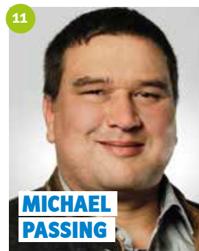
38 Jahre, Schwarzach, Wassermeister, Vereinsvorsitzender, Gemeinderat