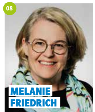
50 Jahre, Mainleus, Lehrerin