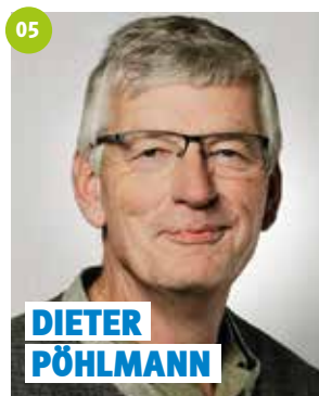
60 Jahre, Mainleus, Lackierermeister, Gemeinderat, Dritter Bürgermeister