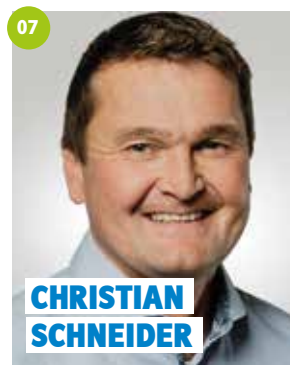
45 Jahre, Mainleus, Dipl.-Wirtschafts-Ing. (FH), Landwirt, Gemeinderat