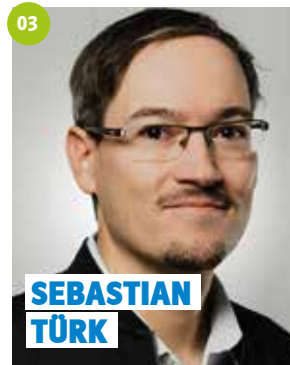
39 Jahre, Mainleus, Unternehmer, Gemeinderat