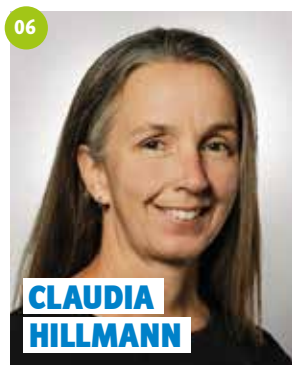
50 Jahre, Mainleus, Produktionsmitarbeiterin