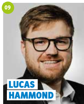
37 Jahre, Buchau, Dipl.-Ingenieur (FH), Ortssprecher