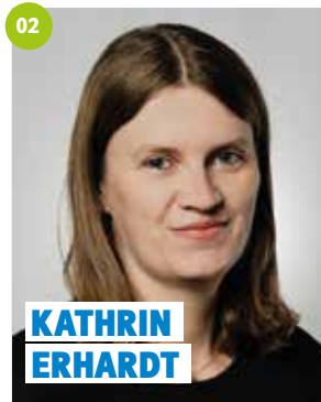
33 Jahre, Motschenbach, Landwirtin