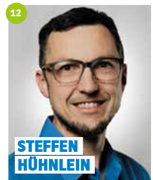
42 Jahre, Rothwind, Religionspädagoge, Feuerwehrkommandant, 2. Vorsitzender Diakonieverein Mainleus, Gemeinderat