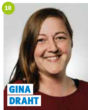
34 Jahre, Mainleus, Software-Entwicklerin Wirtschaftsinformatik B.Sc. (FH)