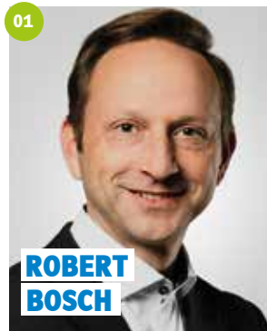
46 Jahre, Mainleus, Dipl.-Ingenieur (univ.), Erster Bürgermeister, Kreisrat